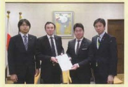
防災対策、市内経済の発展等 6分野43項目に要望

12月16日に自民党川崎市議団は、川崎市に対して予算要望を行いました。依然、厳しい財政状況が続いており、次年度においても引き続き、効果的な予算の運営が求められているところであります。 持続可能な行政運営を構築するため、これからも行財政改革を断行し財政規律を順守しなくてはなりません。市民サービスの向上、市内経済の活性化、さらには環境先進都市として発展していけるよう、自民党川崎市議団は全力で取り組んで参ります。